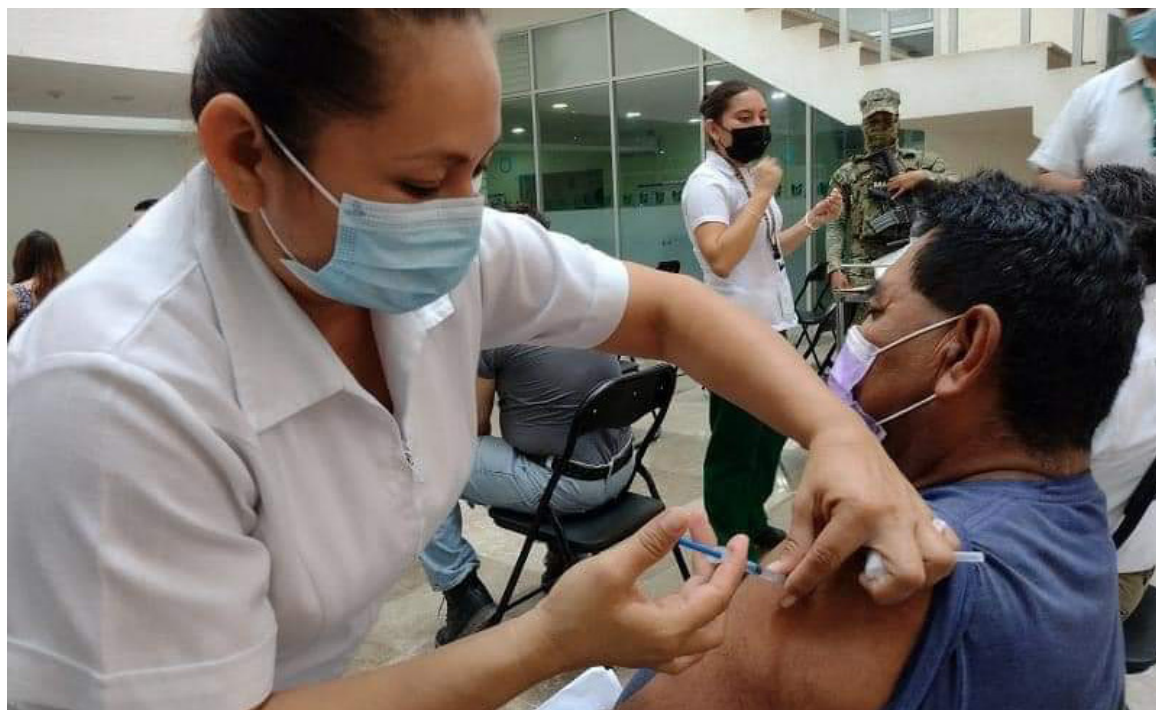
Avance. Se tiene más del 95 por ciento de la población vacunada.

Las entidades que registraron las mayores tasas de divorcios por cada 10 mil habitantes de 18 años o más en 2021 fueron Campeche, con 46.6; Sinaloa, con 40.2, y Coahuila, con 37.4. La tasa nacional fue de 16.9. Las menores tasas correspondieron a Puebla, con 9.1; Oaxaca, con 8.6, y Veracruz, con 6.4.