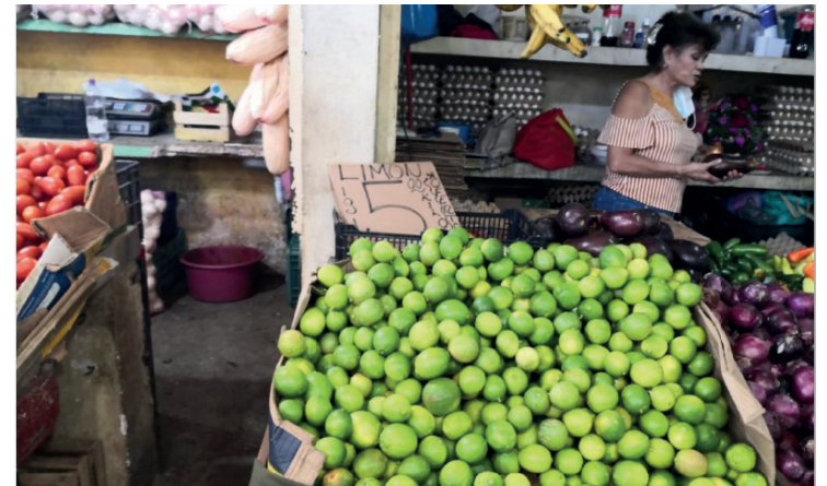
Accesible. En tan solo cinco pesos se expende el kilogramo del cítrico.

Al parecer la disputa política del gobierno estatal con el municipal mantiene entretenidos a los agentes policiacos, quienes se la pasan intimidando las acciones de la Alcaldía y a los funcionarios municipales, en lugar de velar por la seguridad y el bienestar de los ciudadanos.