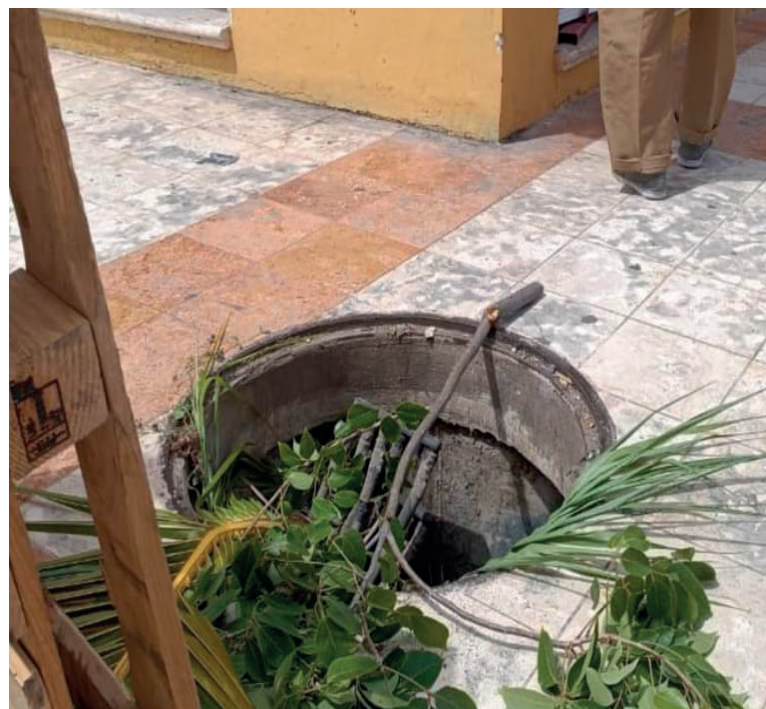
Salvaguarda. Los elementos de Protección Civil Municipal colocaron ramas como señaléticas para evitar posibles incidentes.

En el lugar, trascendió que ambos eran militares pertenecientes al Batallón de Caballería de Escárcega.