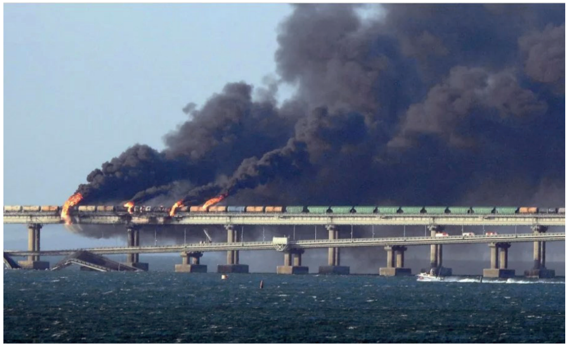
Daño estratégico. La explosión del sábado provocó el colapso de varias partes del puente ferroviario y de carreteras del estrecho de Kerch, inaugurado por el propio Putin en 2018.

El papa Francisco también aprovechó la oportunidad para orar por todas las víctimas del “loco acto de violencia” ocurrido en Tailandia, donde un policía despedido mató a bala y cuchillo a 36 personas, 24 de las cuales niños.