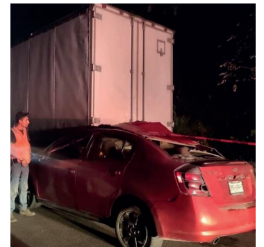
Aparatoso. El guionero del Sentra se impactó contra la unidad pesada en la carretera Escárcega.

Al lugar arribó la Unidad de Rescate y Urgencias Médicas del Ayuntamiento de Champotón, a través de su unidad de traslados, así como unidades de la Guardia Nacional,