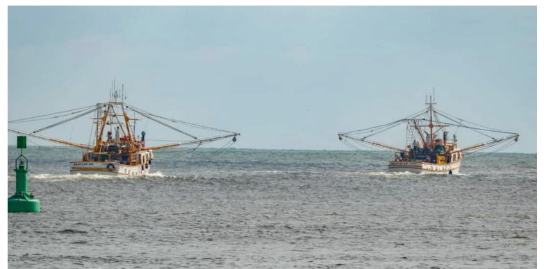
En problemas. No les da ni pasa sacar gastos de avituallamiento.

Reiteró que con 100 y 200 kilogramos no se puede calificar como una buena temporada