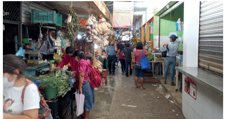
Buscan solución. El empleo informal gana terreno.

ello está por debajo de la meta de este año y que es de 142 mil empleos formales en la entidad.